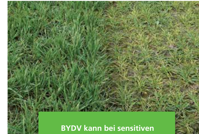
BYDV kann bei sensitiven Sorten enorme Ertrags- einbußen hervorrufen.