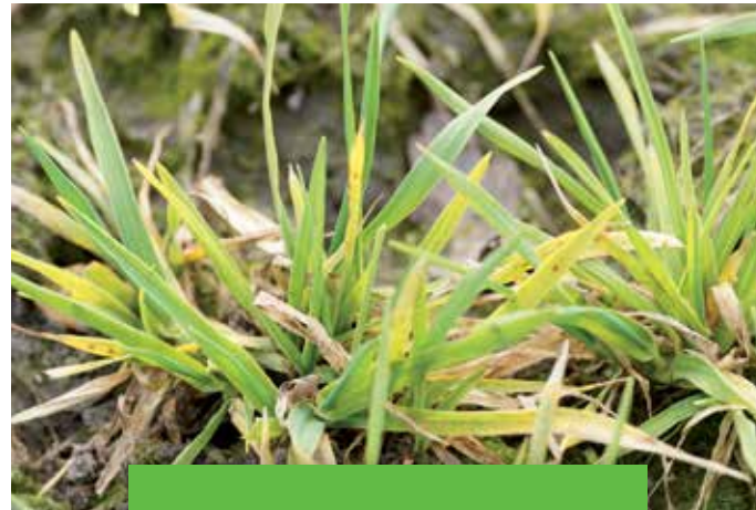
BYDV – verzwergte Pflanzen