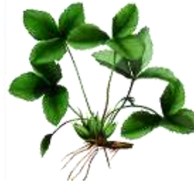
BBCH 92 nach der Ernte