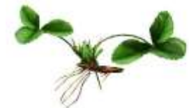
BBCH 97-00 Vegetationsruhe