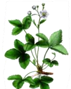
BBCH 61 Blühbeginn