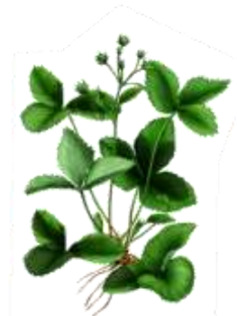
BBCH 57 vor der Blüte