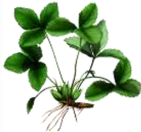
BBCH 92 nach der Ernte

Kerb Flo 1,25 l/ha + Stomp Aqua 2,5 - 3,0 l/ha + Herbosol 0,4 l/ha