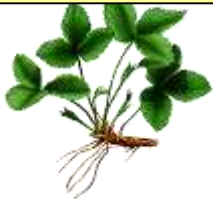
BBCH 41 Ausläufer- entwicklung

(Zwischenreihenbehandlung zur Ausläuferabtötung)