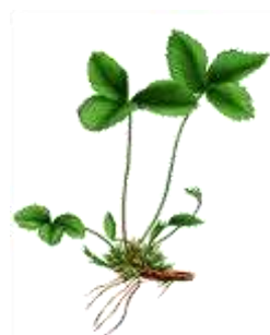
BBCH 55 Blütenanlage