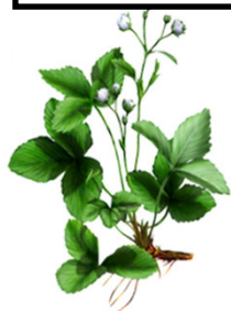
BBCH 59 Ballonstadium