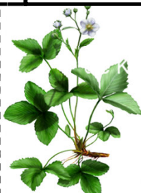
BBCH 61 Beginn der Blüte