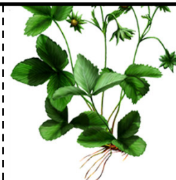
BBCH 67 abgehende Blüte