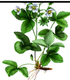
BBCH 65 Vollblüte