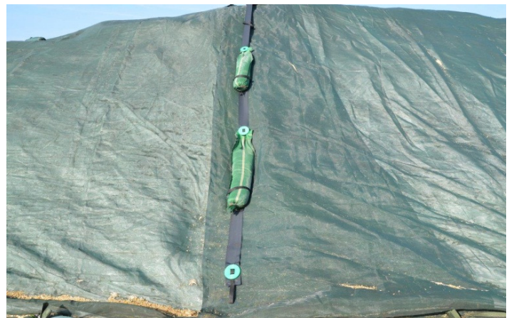
Silosackträger mit Säcken